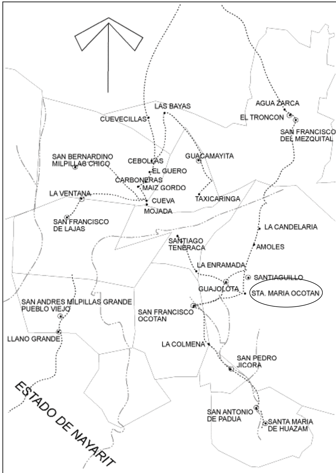
Mapa 1. Parte del estado de Durango donde se habla el tepehuano del sur